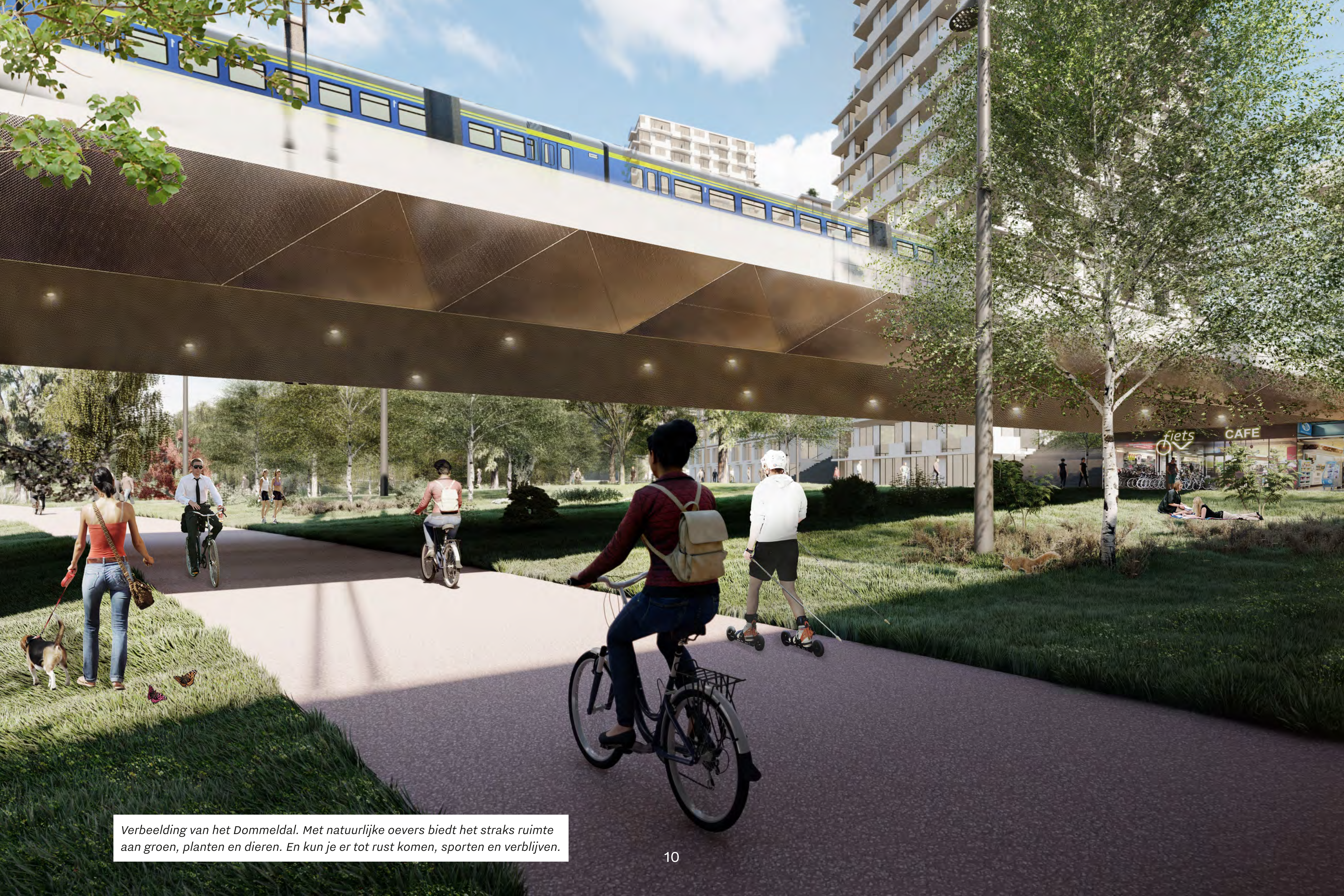
Verbeelding van het Dommeldal. Met natuurlijke oevers biedt het straks ruimte aan groen, planten en dieren. En kun je er tot rust komen, sporten en verblijven.