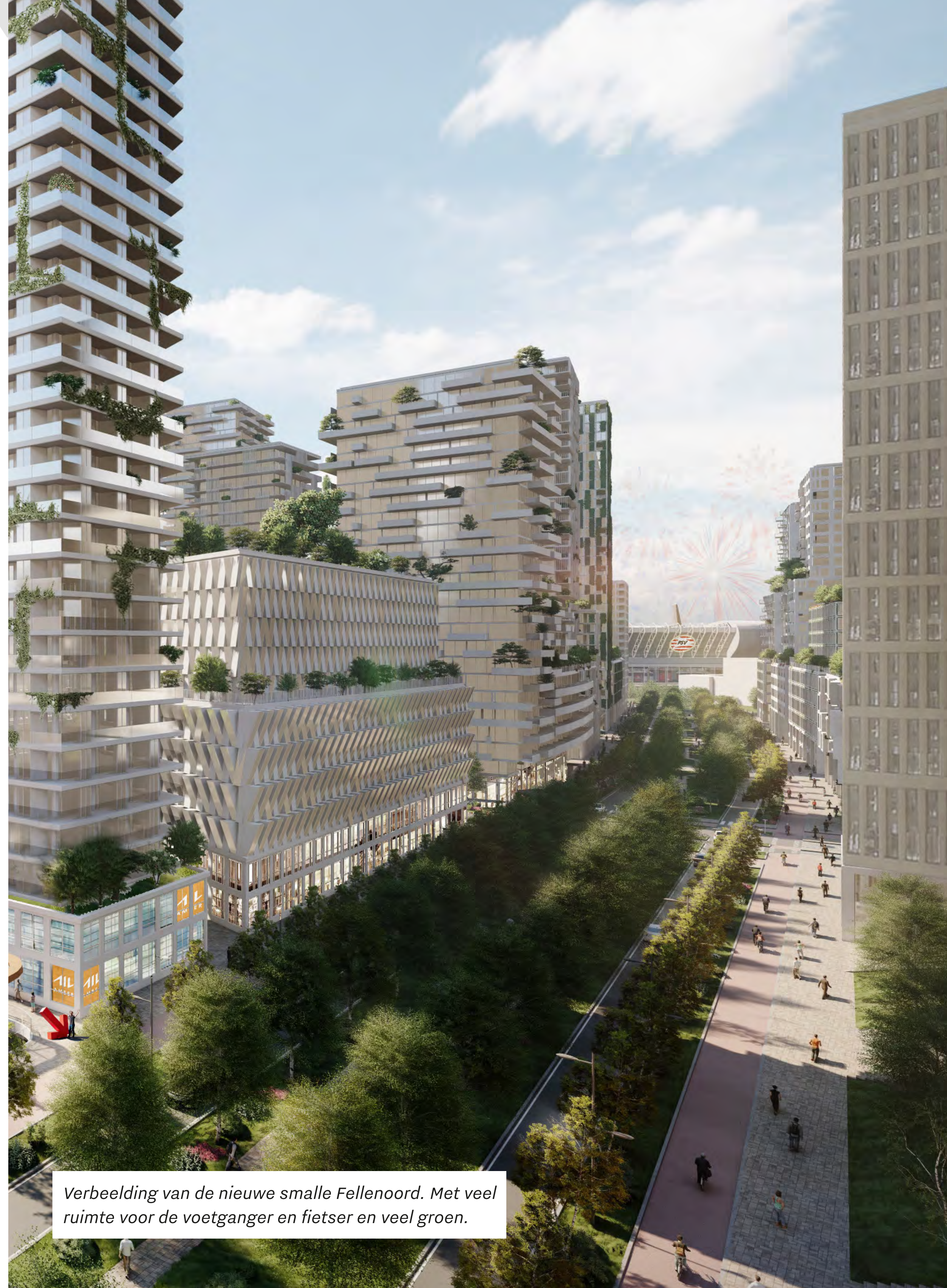
Verbeelding van de nieuwe smalle Fellenoord. Met veel ruimte voor de voetganger en fietser en veel groen.

Dus daar sta je dan, over pakweg twintig jaar, met dat bonte gezelschap dat je een dag langs de leukste plekken van Eindhoven gaat leiden. Je denkt na. Aan de zuidkant beginnen? Nee, dat komt later wel. Eerst laat je vol trots de laatste parel zien: Fellenoord, het fonkelnieuwe visitekaartje van het almaar innoverende Eindhoven.