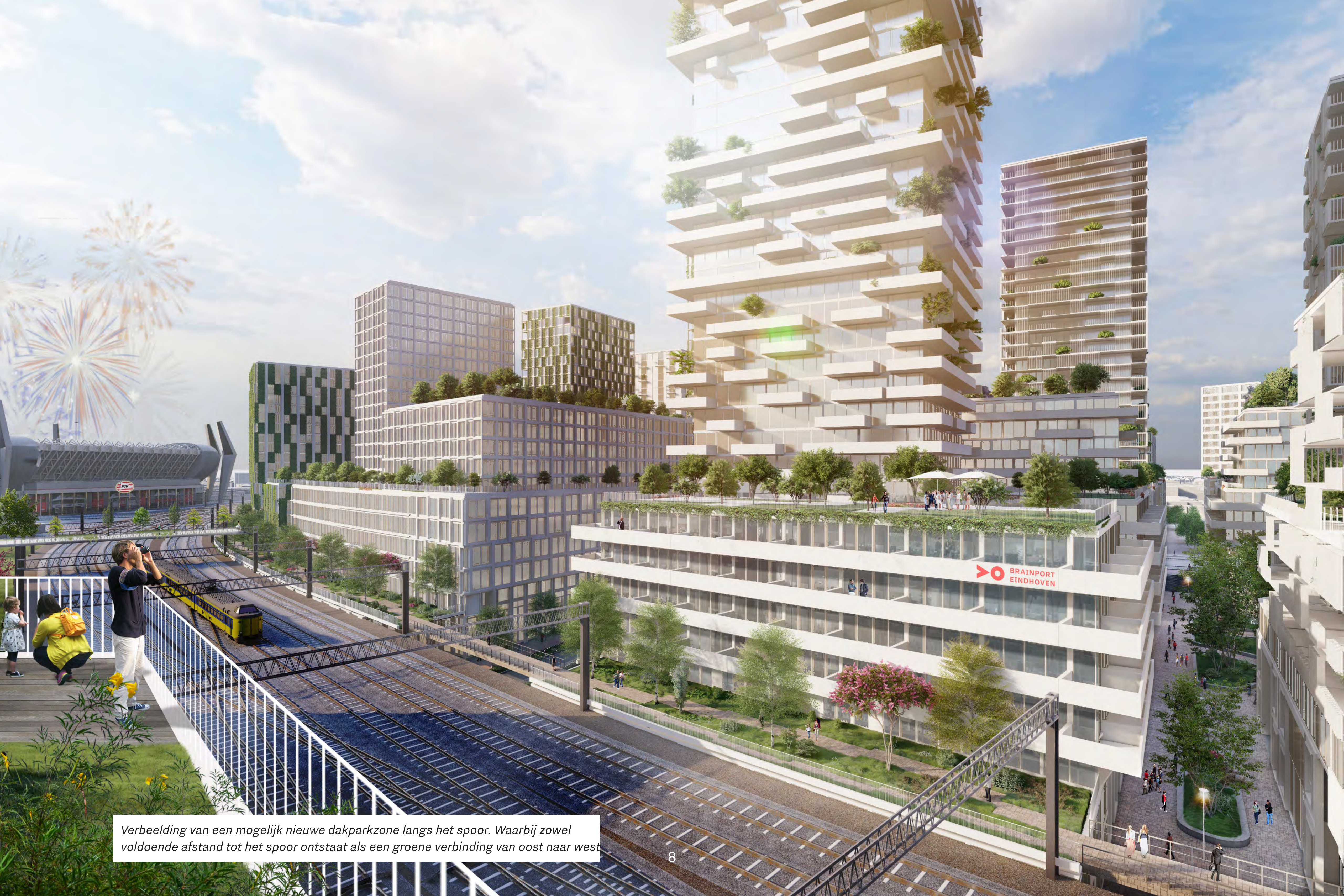
Verbeelding van een mogelijk nieuwe dakparkzone langs het spoor. Waarbij zowel voldoende afstand tot het spoor ontstaat als een groene verbinding van oost naar west