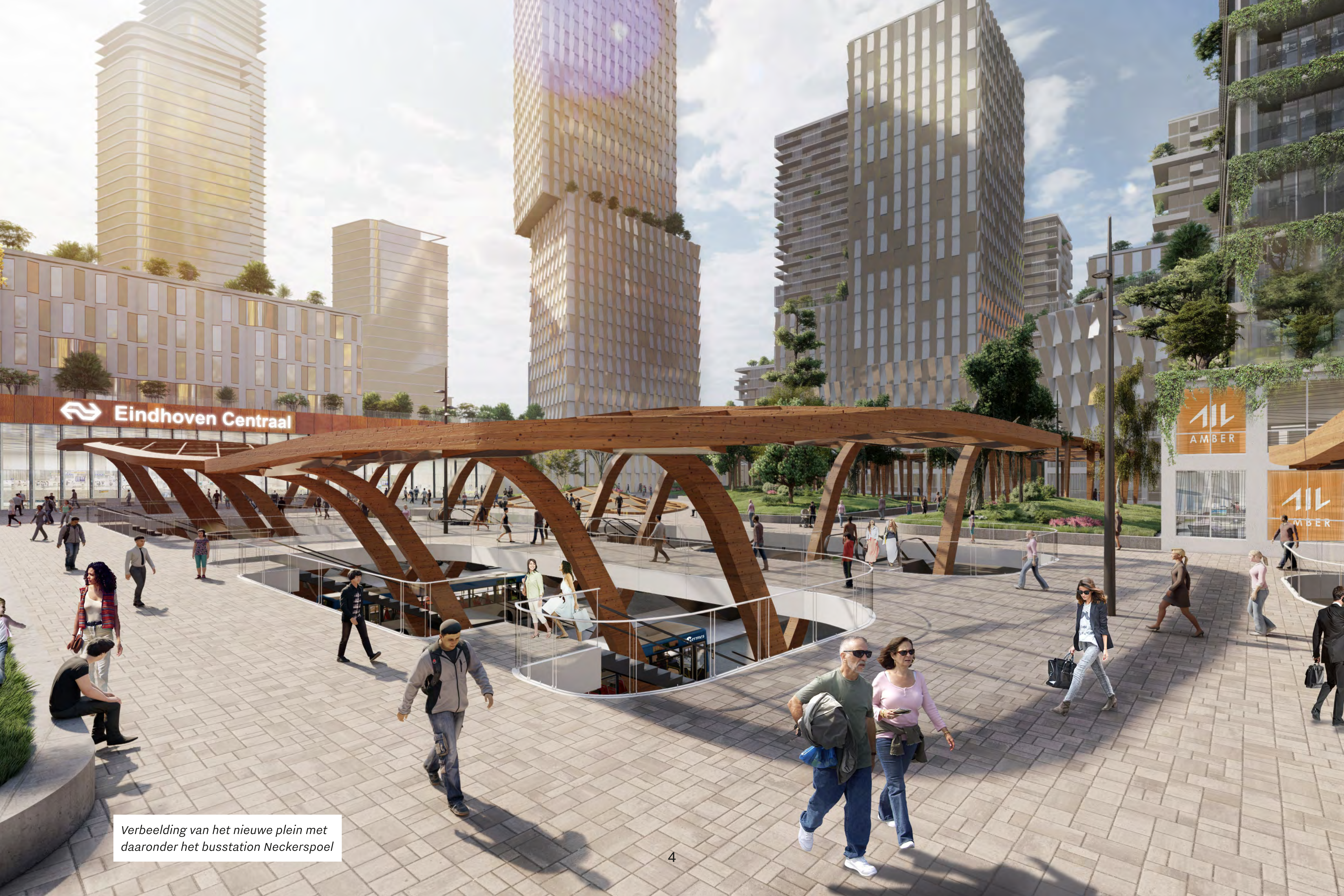
Verbeelding van het nieuwe plein met daaronder het busstation Neckerspoel